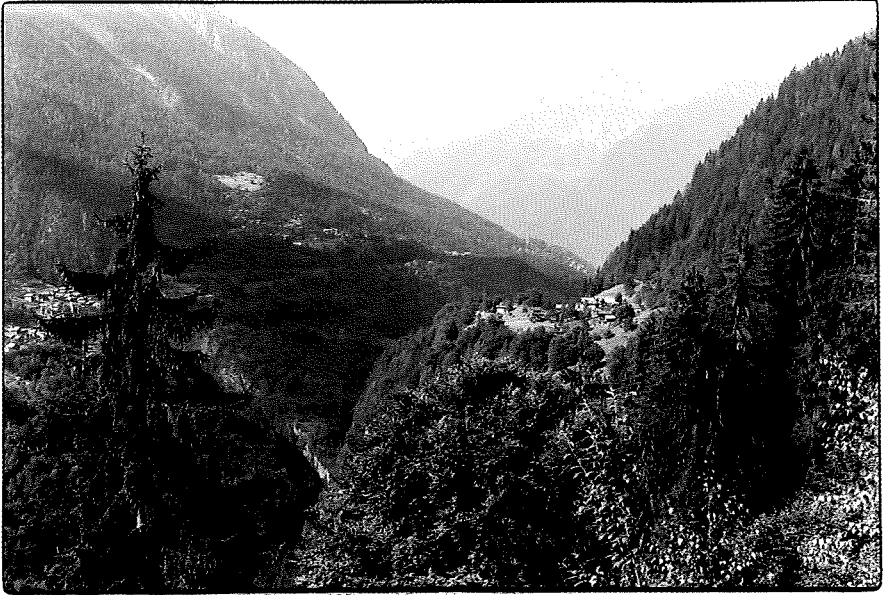
La vallée du Trient et son ouverture sur la vallée du Rhône. À gauche du sapin, Le Trétien et, au deuxième plan, Salvan. À droite, le hameau de La Crettaz, au-dessus de Gueuroz.